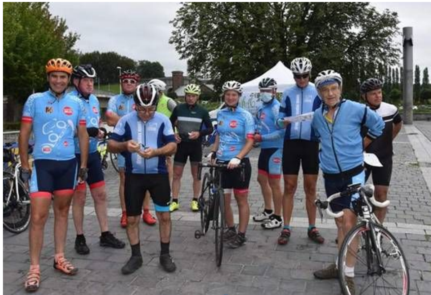
Samedi 4 septembre, un peloton de 31 maillots bleus quitte Ath à 8h en direction de Bray-Dunes.